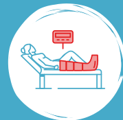
Beinmanschette mit 12 Luftkammern