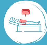
Hüftmanschette mit 6 oder 12 Luftkammern