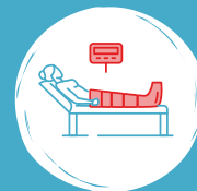
Kompressionshose mit 24 Luftkammern