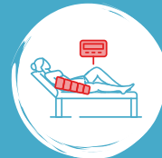
Armmanschette mit 12 Luftkammern